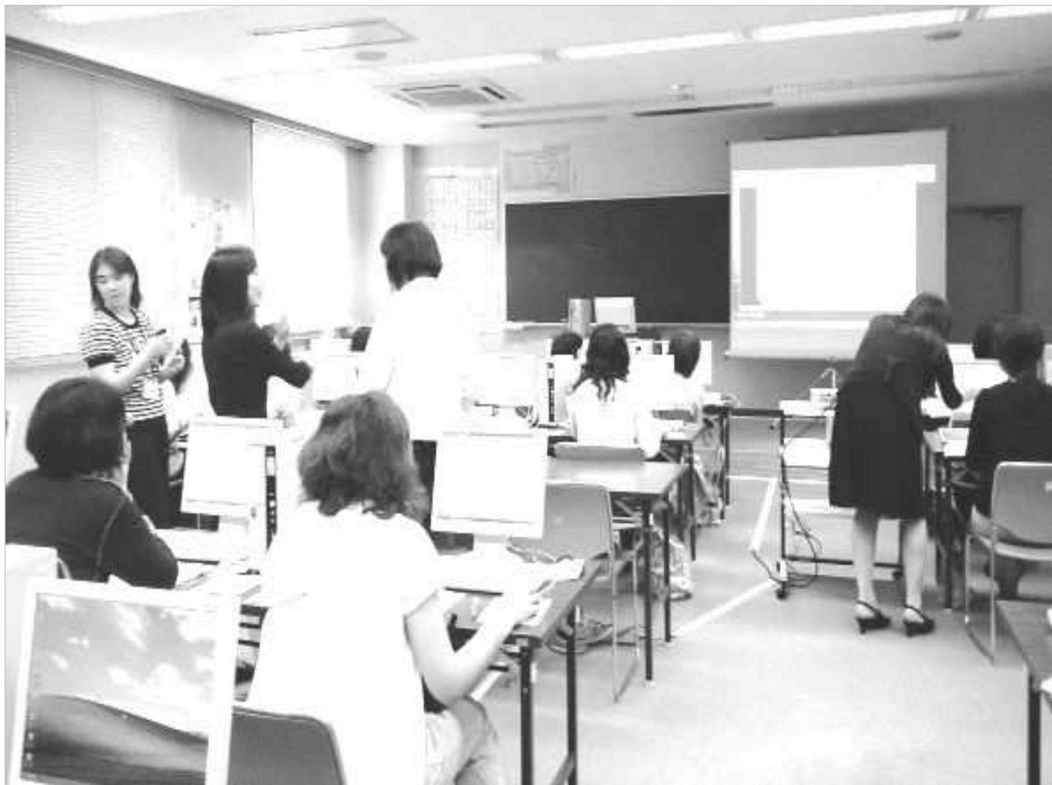
地域の IT 活性化支援活動として、一般市民を対象に年 3 回行っている IT 講習会の様子 (詳細は4頁に掲載)